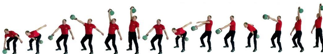
Рис. 4. Рывок гири

При нарушении условий выполнения упражнения повторение не засчитывается, подается команда «НЕ СЧИТАТЬ».