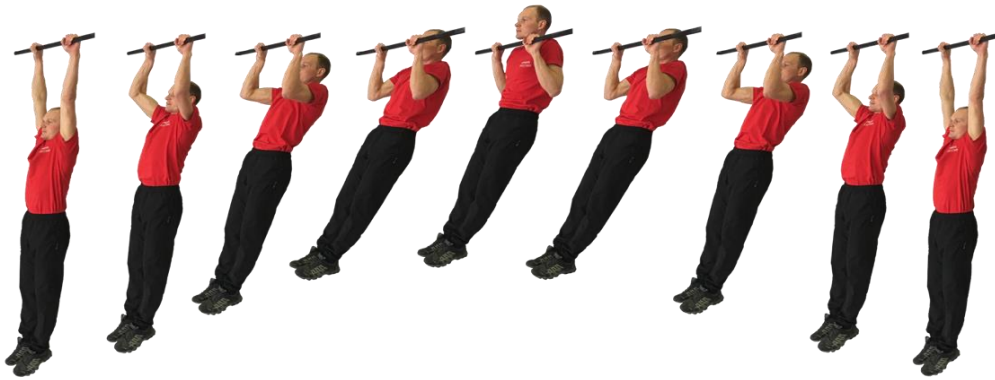
Рис. 1. Подтягивание на перекладине