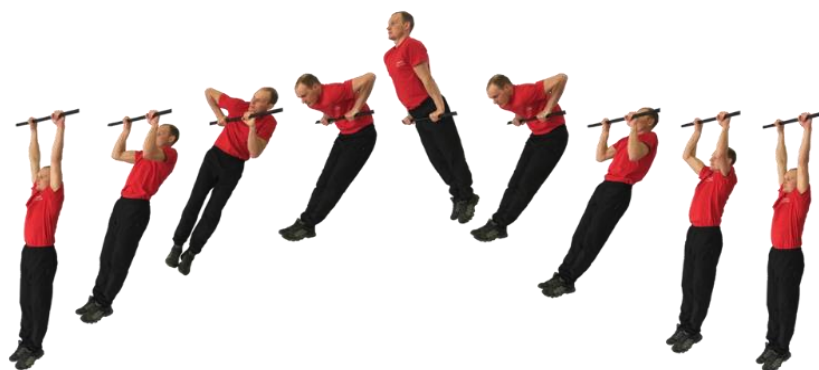
Рис. 3. Подъем силой на перекладине