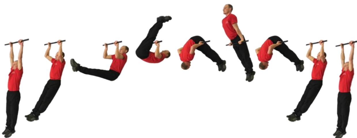
Рис. 2. Подъем переворотом на перекладине