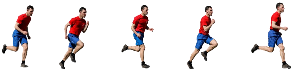
Рис. 5. Бег на 60 м, бег на 100 м