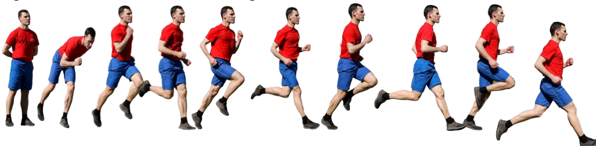
Рис. 7. Бег на 1 км, бег на 3 км.

Старт и финиш, как правило, оборудуются в одном месте. При выполнении упражнений на беговой дорожке стадиона старт и финиш производится в соответствии с разметкой стадиона.